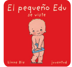
El pequeño Edu se viste 978-84-261-3420-0