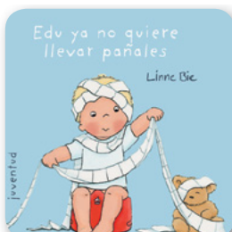
Edu ya no quiere llevar pañales 978-84-261-3799-9