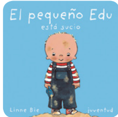
El pequeño Edu está sucio 978-84-261-3418-9