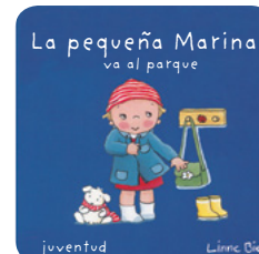
La pequeña Marina va al parque 978-84-261-3874-3