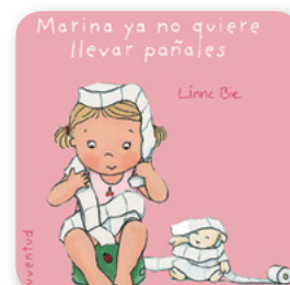
Marina ya no quiere llevar pañales 978-84-261-3801-9