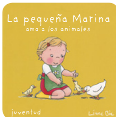
La pequeña Marina ama a los animales 978-84-261-3873-6