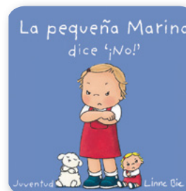
La pequeña Marina dice '¡No!' 978-84-261-4067-8