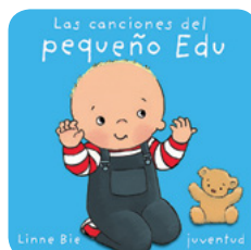
Las canciones del pequeño Edu 978-84-261-3696-1