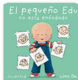
El pequeño Edu no está enfadado 978-84-261-4065-4