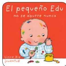
El pequeño Edu no se aburre nunca 978-84-261-3694-7