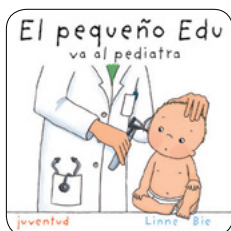
El pequeño Edu va al pediatra 978-84-261-3693-0