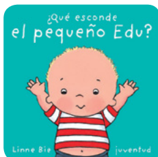
¿Qué esconde el pequeño Edu? 978-84-261-3695-4