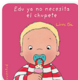
Edu ya no necesita el chupete 978-84-261-3797-5